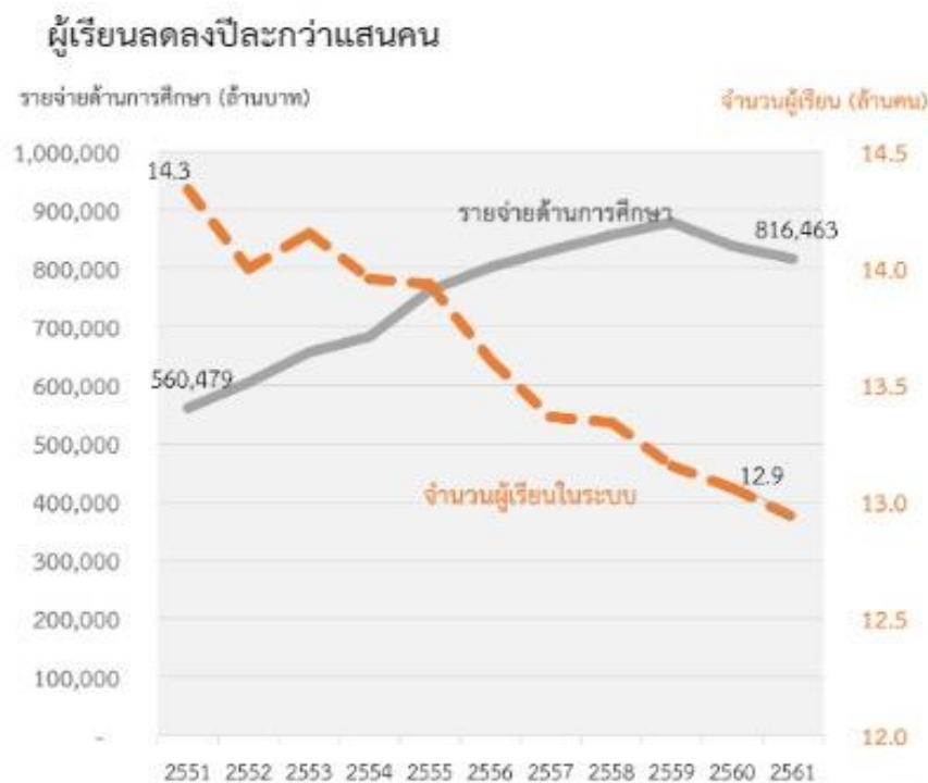
รูปที่ ๓ : จำนวนผู้เรียนและรายจ่ายด้านการศึกษา

หรือว่างงาน ในขณะที่เดียวกัน แม้ว่าแรงงานนอกระบบจะมีทางเลือกในการเข้าร่วมระบบการออมเพื่อการเกษียณภาคสมัครใจที่ภาครัฐร่วมจ่ายสมทบซึ่งเป็นช่องทางที่จะช่วยสร้างหลักประกันทางรายได้ในวัยสูงอายุ แต่ยังคงมีจำนวนผู้เข้าร่วมเพียงประมาณร้อยละ ๓๕ ของแรงงานนอกระบบทั้งหมด 6