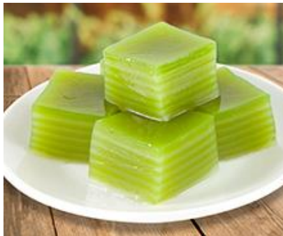
รูปที่ ๔ : สังคม “ขนมชั้น”

ความยากจนของครัวเรือนยากจนข้ามรุ่นในประเทศไทยเป็นปัญหาพื้นฐานที่สำคัญที่ควรต้องได้รับการแก้ไขจากทุกภาคส่วนที่เกี่ยวข้อง เนื่องจากปัญหาดังกล่าวเกิดขึ้นมาเป็นระยะเวลาอันยาวนาน มีแนวโน้มที่จะทวีคูณความรุนแรงมากยิ่งขึ้น และก่อให้เกิดความเหลื่อมล้ำต่าง ๆ เช่น การศึกษา สวัสดิการทางสังคม การประกอบอาชีพ เป็นต้น ความเหลื่อมล้ำดังกล่าวทำให้สังคมไทยในปัจจุบันเปรียบเสมือนสังคม “ขนมชั้น” โดยเปรียบคนฐานะรวย ฐานะปานกลาง และฐานะจน อยู่กันคนละชั้น แต่สัมผัสกันอยู่และวางเรียงกันเป็นรูปแต่ไม่ได้ผสมผสานเป็นเนื้อเดียวกันของขนม และระหว่างชั้นก็ถูกดึงแยกออกจากกันได้โดยไม่ยากเย็นอะไร 9 แม้แนวทางการแก้ไขที่ได้กล่าวในบทความนี้เป็นเพียงแค่นำแนวทางแต่หากทำได้จริงจะทำให้สามารถแก้ไขความยากจนของครัวเรือนยากจนข้ามรุ่นในประเทศไทยได้อย่างถูกต้อง และมีประสิทธิภาพ รวมถึงจะทำให้คนในสังคมไทยไม่ว่าจะอยู่ในฐานะอะไรจะรวมกันเป็นหนึ่งเดียวไม่เป็นสังคม “ขนมชั้น” อีกต่อไปในอนาคต