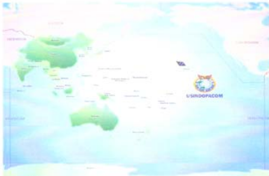
รูปที่ ๔ พื้นที่รับผิดชอบของกองกำลังภาคพื้นสหรัฐ อินโด-แปซิฟิก USINDOPACOM