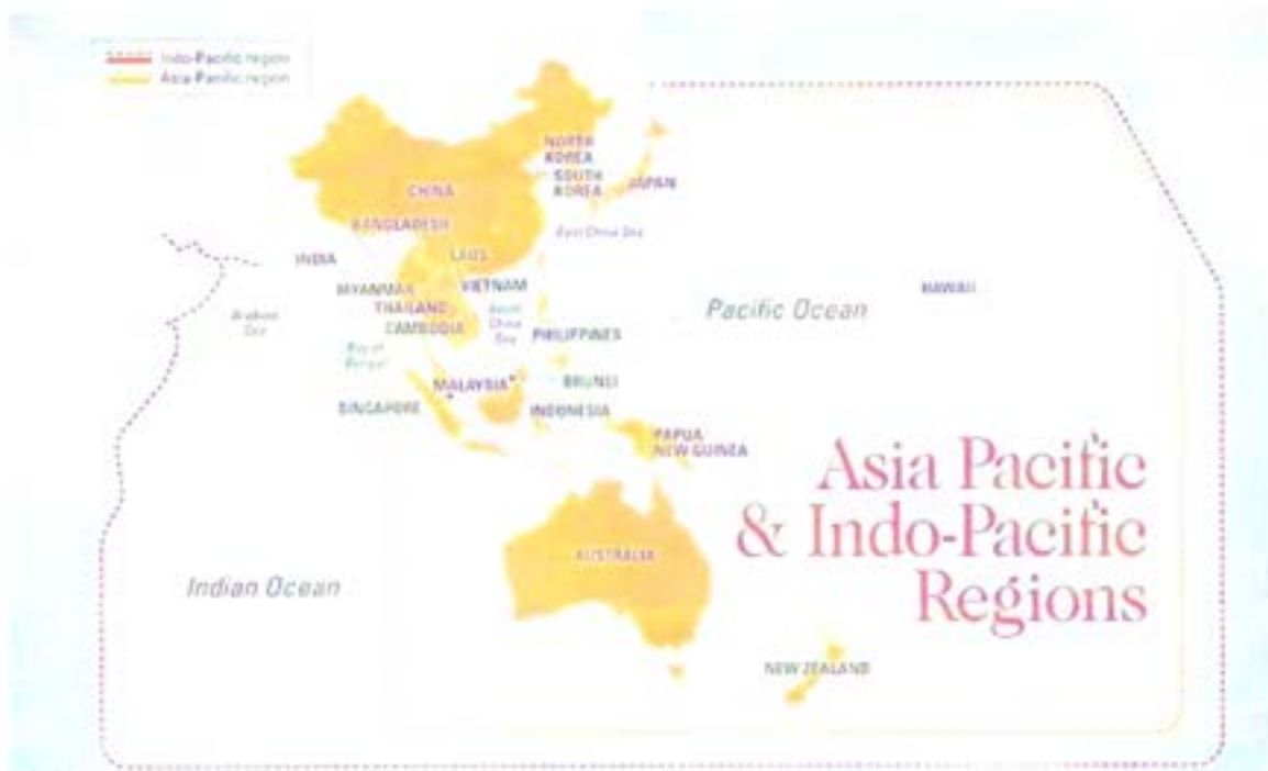
รูปที่ ๒ อาณาเขตของภูมิภาคเอเชีย-แปซิฟิก และอินโด-แปซิฟิก

เอเชียใต้ ภายใต้ยุทธศาสตร์ BRI ซึ่งอินเดียมองว่าส่งผลกระทบต่อการเมืองและความมั่นคงของอินเดียโดยตรง ดังนั้น กลุ่มพันธมิตร ๔ ประเทศ Quadrilateral Security Dialogue (Quad) ประกอบด้วย สหรัฐอเมริกา ญี่ปุ่น ออสเตรเลีย และอินเดีย จึงเห็นด้วยกับแนวคิด “อินโด-แปซิฟิก” (ที่ใช้คำว่าอินโด-แปซิฟิก แทนคำว่า เอเชีย-แปซิฟิกเหมือนกับสหรัฐอเมริกา ซึ่งมีนโยบายถึงการสนับสนุนสหรัฐอเมริกาในการเสริมสร้างความมั่นคง ความมั่นคง และครอบคลุมทั้งมหาสมุทรอินเดีย และมหาสมุทรแปซิฟิก) โดยให้ความสำคัญกับอินเดีย โดยผนวกพื้นที่ทางภูมิศาสตร์ของมหาสมุทรอินเดียเข้ากับมหาสมุทรแปซิฟิก ครอบคลุมพื้นที่เอเชียตะวันออกเฉียง เอเชียตะวันออกเฉียงใต้ ข้ามมหาสมุทรแปซิฟิกจรดชายฝั่งสหรัฐอเมริกา พร้อมทั้งส่งเสริมบทบาทอินเดียให้ร่วมรับผิดชอบการสร้างดุลยภาพ เพื่อคานอิทธิพลของจีนในภูมิภาคเอเชีย-แปซิฟิก และให้ออสเตรเลียมีส่วนร่วม เนื่องจากมีกองทัพเรือที่มีแสนยานุภาพพอที่จะ “ถ่วงดุล” กับจีนได้ (สาธิต มนต์สักรกุล, ๒๕๖๓)