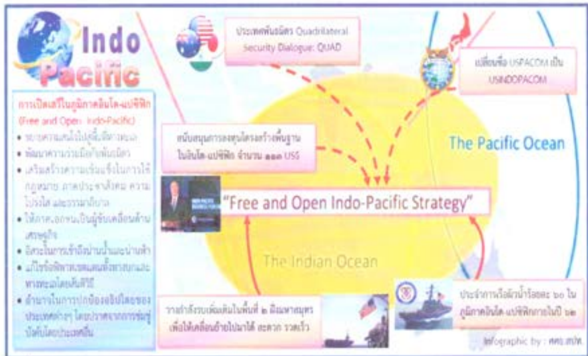
รูปที่ ๓ ยุทธศาสตร์เปิดเสรีในภูมิภาคอินโด-แปซิฟิก (Free and Open Indo-Pacific)

ในการดำเนินยุทธศาสตร์อินโด-แปซิฟิกที่เป็นรูปธรรม ปรากฏทั้งในมิติด้านความมั่นคงและมิติด้านเศรษฐกิจ ดังนี้